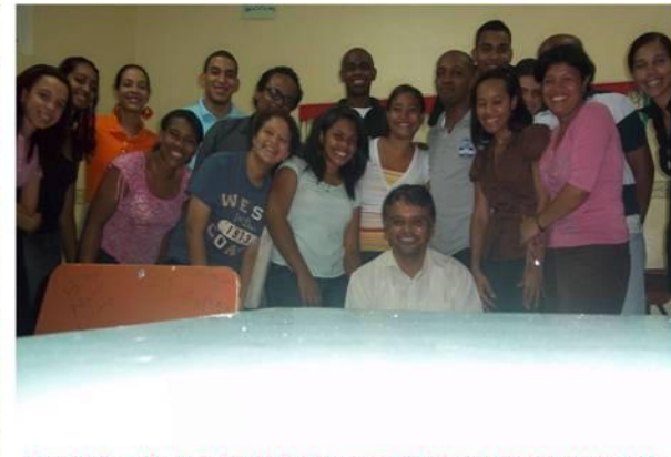
1era Escuela de Movilizadores de Misiones en la Iglesia Trinidad, Agosto 2011 Republica Dominicana.