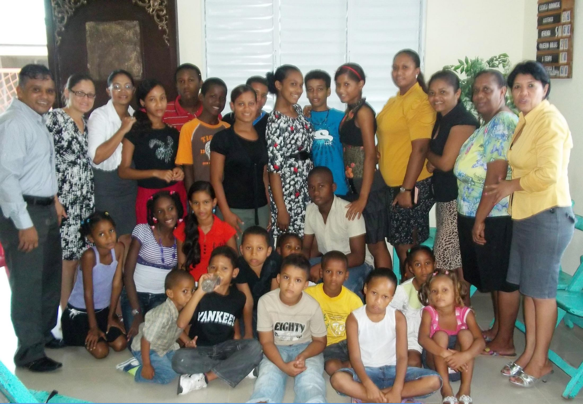
Adolescentes del CCMA y RIMI de Nagua RD