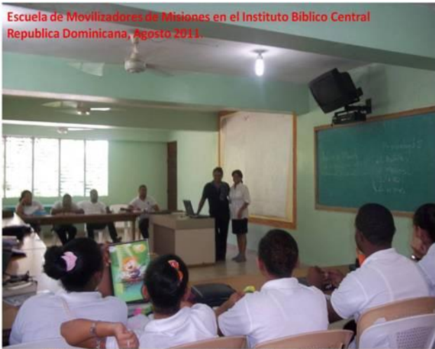
Escuela de Movilizadores de Misiones en el Instituto Biblico Central Republica Dominicana, Agosto 2011.