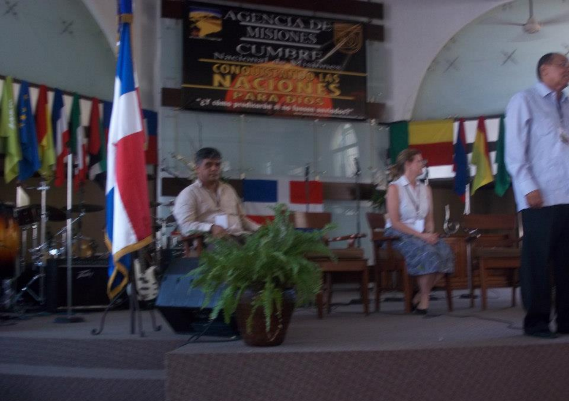
Realización de la Primera Cumbre Nacional de Misiones