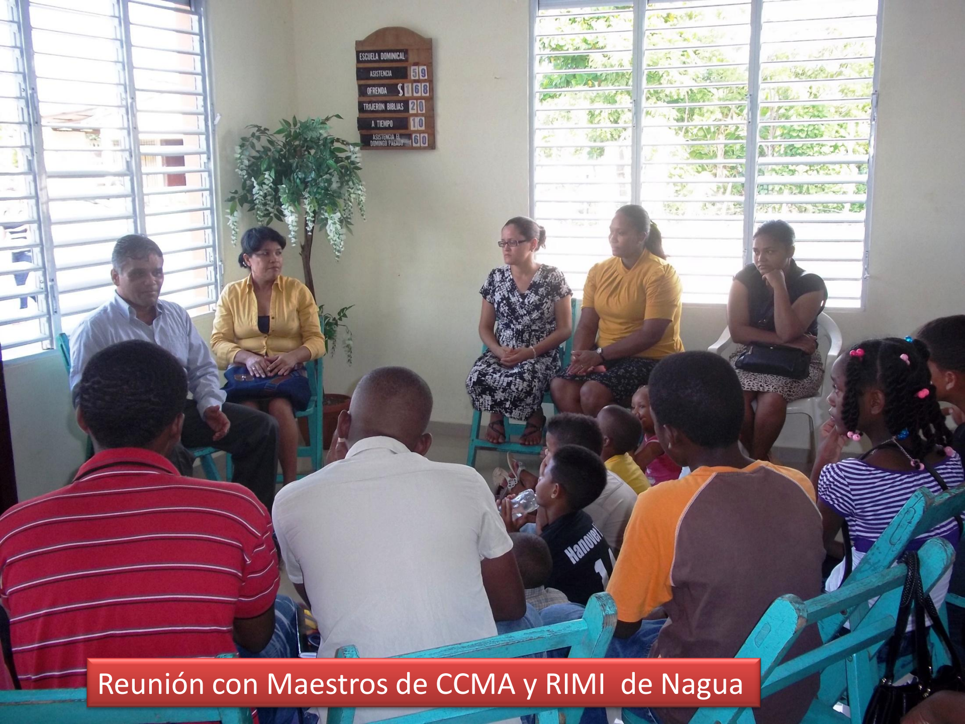
Reunión con Maestros de CCMA y RIMI de Nagua