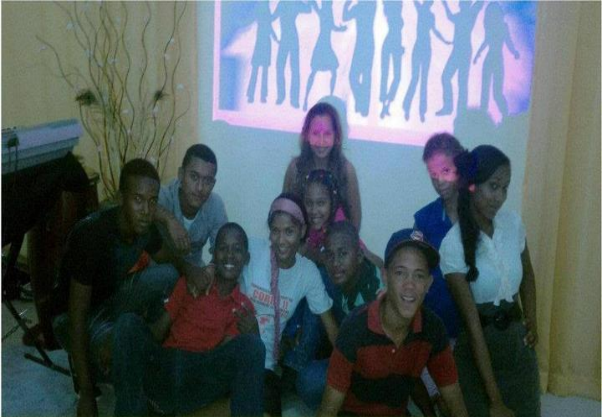
Adolescentes del Primer CMA en RD, Inaugurado el 16 de Junio 2012