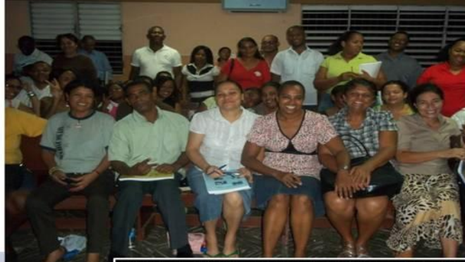
EMM IGLESIA CENTRAL A/D SANTO DOMINGO 56 ALUMNOS