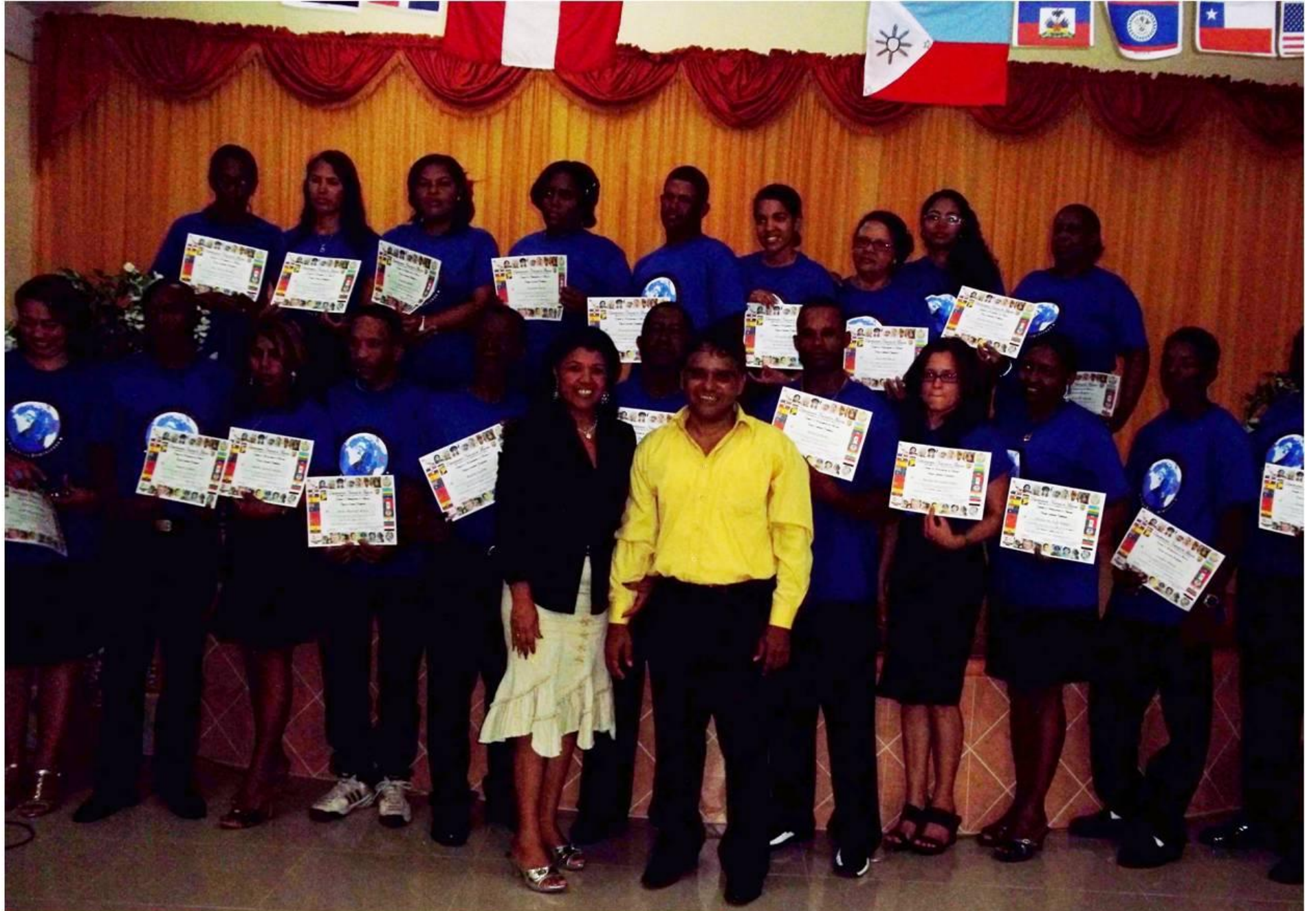
Graduación en Nagua, RD. 4 de Marzo 2012