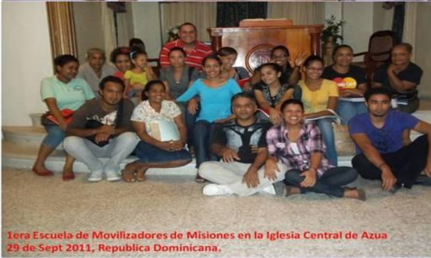
1era Escuela de Movilizadores de Misiones en la Iglesia Central de Azua 29 de Sept 2011, Republica Dominicana.