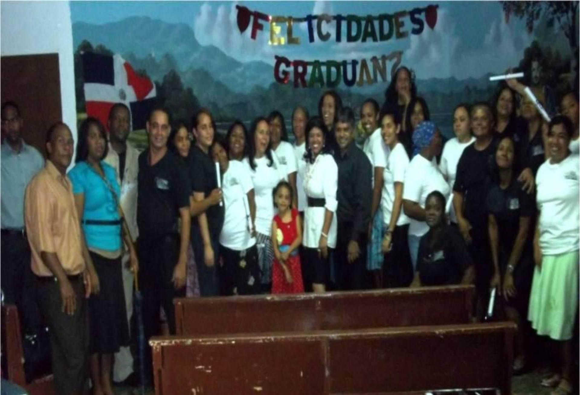
38 DE 56 SE GRADUARON EN LA IGLESIA CENTRAL DE LA DUARTE AD, GRACIAS A DIOS