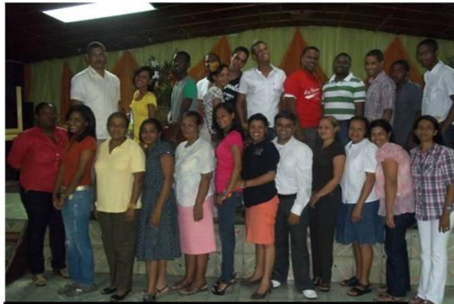
EMM de Iglesia Filipenses 3:14 Villa Altagracia