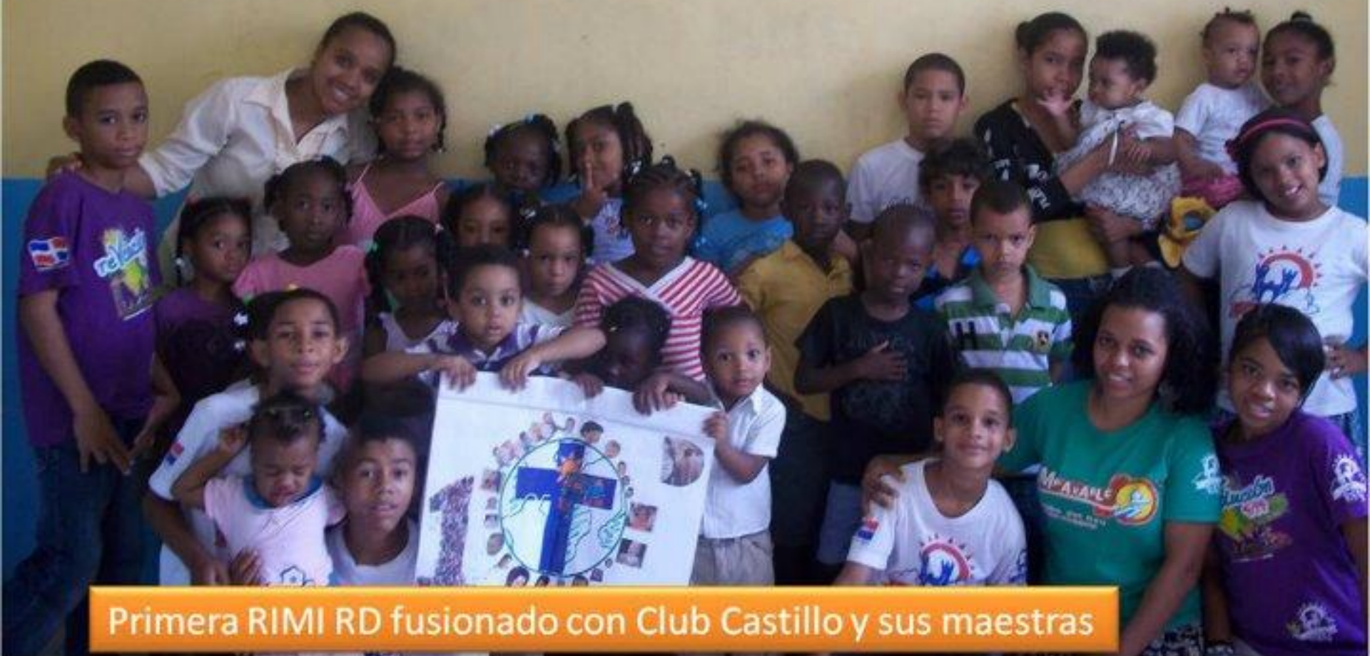
Primera RIMI RD fusionado con Club Castillo y sus maestras